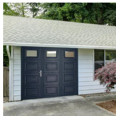
Porte 3 vantaux, motif cassette Hublots rectangle n°1 en option. Panneau acier