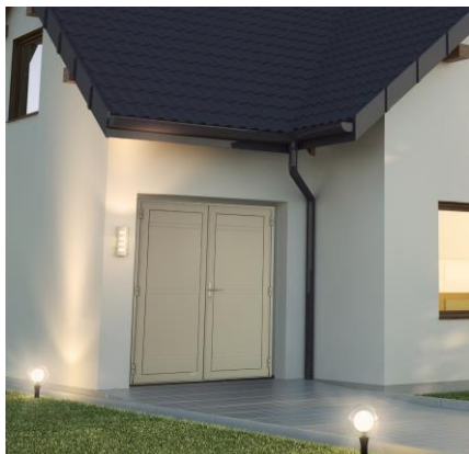
Porte 2 vantaux, finition lisse double nervure - double paroi aluminium