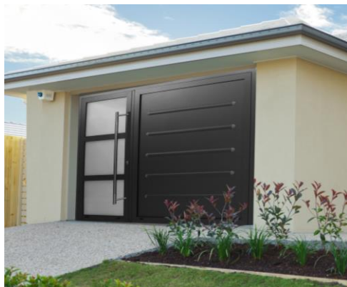
Porte 2 vantaux, finition lisse sans motif - vantaux inégaux avec vantail de service vitré et decor Alliance en option