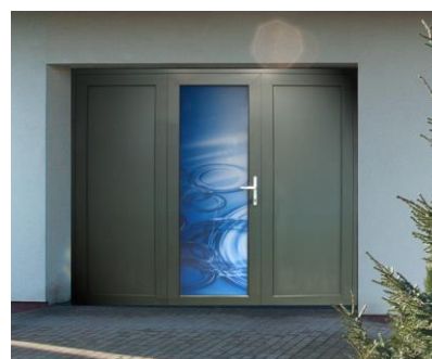
Porte 3 vantaux, sans motif, double paroi aluminium. En option : Verre graphique à thème